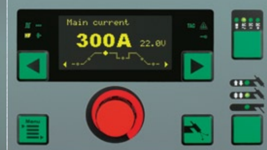
Bedieningspaneel MW 3000 Comfort