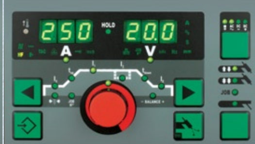
Bedieningspaneel MW 2500 Job