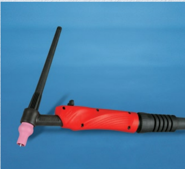
De watergekoelde TTW 2500 WIG-lasbrander met geïntegreerde Up-/Down-schakelaars.

Fronius is een leverancier van systemen. Ieder onderdeel is ideaal op het andere afgestemd en harmonieert perfect. Van de stroombron, via de afstandsbedieningen, de koelapparaten, de wagens tot de meeste uiteenlopende robot-interfaces, maar ook tot complete lasgegevens- documentatie en visualisatie.