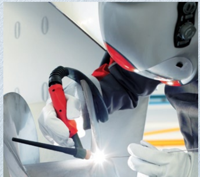
Dankzij de ergonomisch vormgegeven greep ligt de lasbrander goed in de hand. De perfect geïntegreerde knikbeveiliging garandeert een nauwkeurige brandersturing, ook wanneer de slangen een hoek maken.