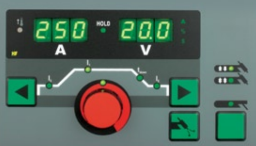
Bedieningspaneel TT 2500 Standaard