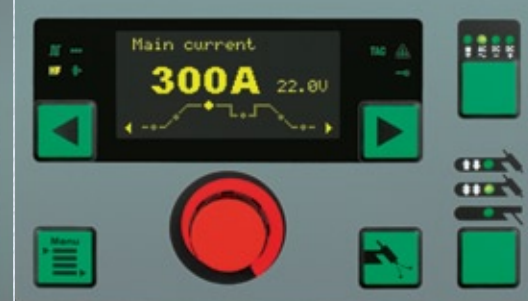
Bedieningspaneel MW 3000 Comfort